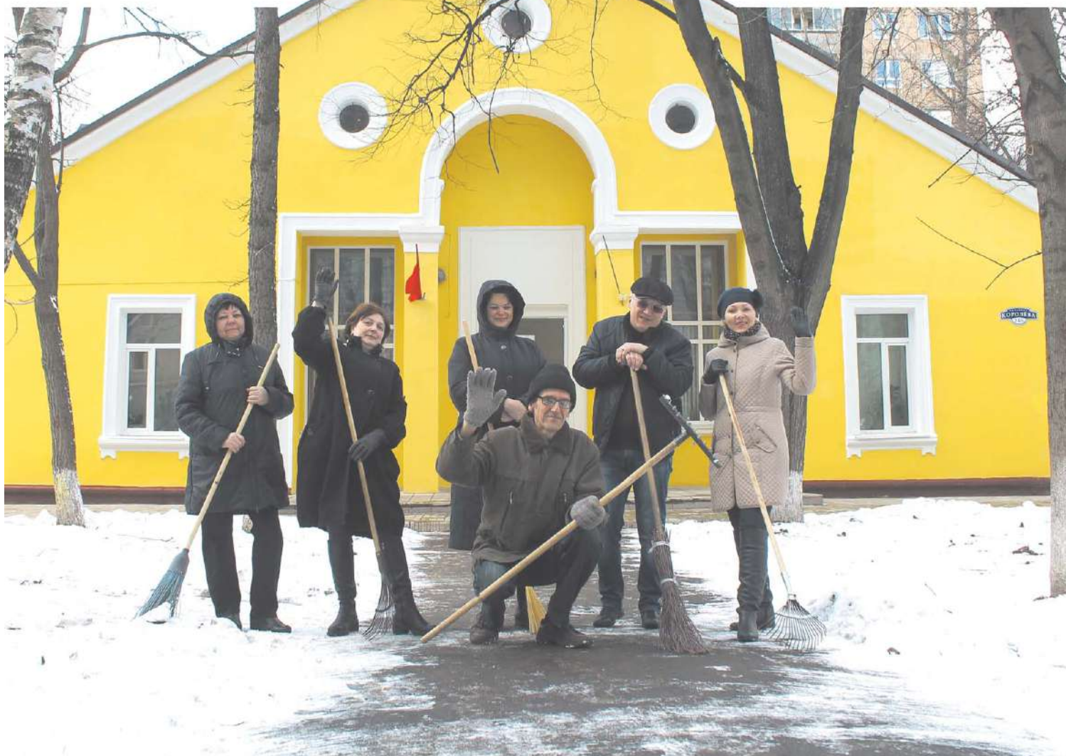
Сотрудники МБУ ДО «Центр Орбита» к субботнику готовы!

ПРИВЕСТИ В ПОРЯДОК ТЕРРИТОРИИ ПОСЛЕ ЗИМЫ КАК МОЖНО СКОРЕЕ – ТАКУЮ ЗАДАЧУ ПОСТАВИЛ ГУБЕРНАТОР МОСКОВСКОЙ ОБЛАСТИ ПЕРЕД РУКОВОДСТВОМ МУНИЦИПАЛИТЕТОВ.