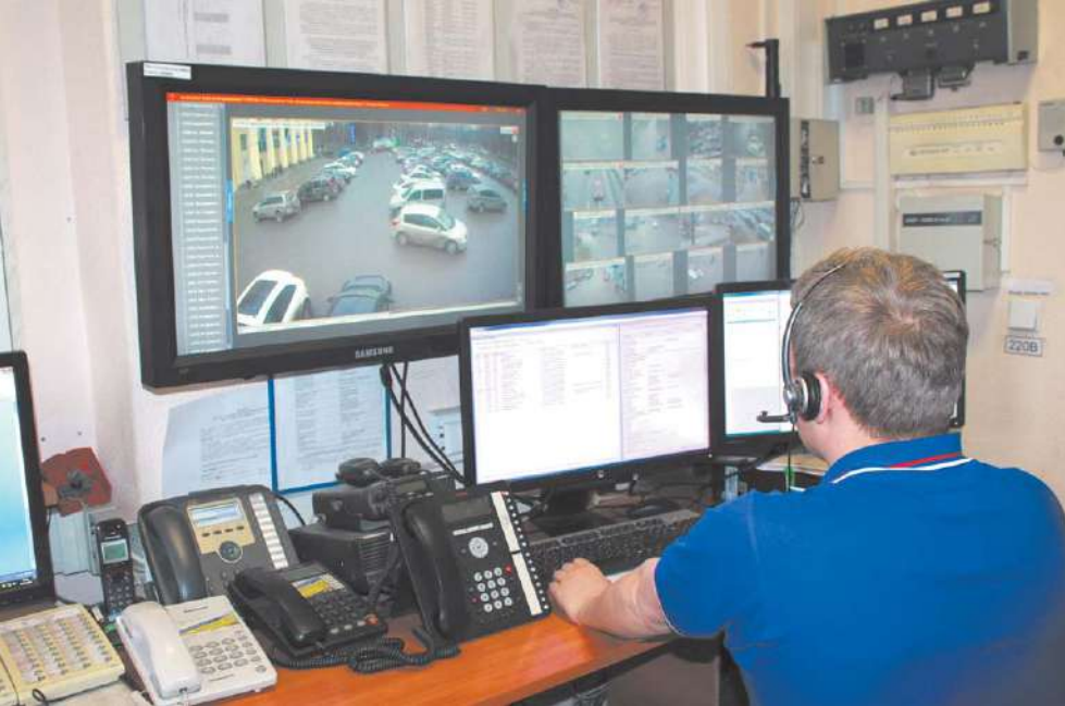
Система видеонаблюдения помогает и предупредить, и раскрыть преступления

В начале аллеи, ведущей к стеле, плита с названием мемориального комплекса. Идём дальше, разглядываем выставленные вдоль дороги небольшие стенды с фотографиями. Сворачиваем налево, и вот она – 16-метровая гранитная стела в форме крыла самолёта, стоящая на месте падения МиГa. На её лицевой стороне высечены