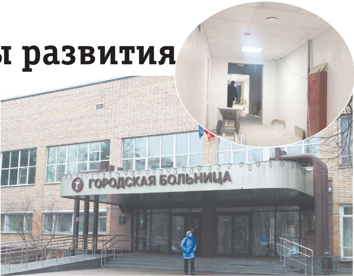
В главном корпусе больницы идёт ремонт отделений

монты и других медучреждений города, на проведение ремонтных работ требуется ещё свыше 2,5 млрд рублей». Озвучены на заседании и проблемы, ожидающие решения в перспективе, такие, как дефицит