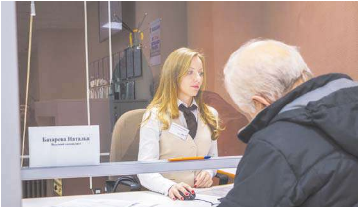
Услуги МФЦ востребованы горожанами