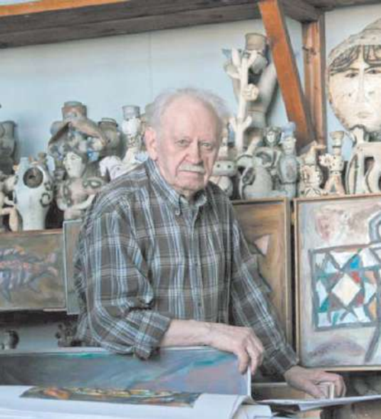
Евгений Расторгуев был одним из ярких художников XX века

Расторгуев и сам был человеком, склонным к перемене мест, как его «Шагающий». Они с женой путешествовали по странам и материкам, что нашло