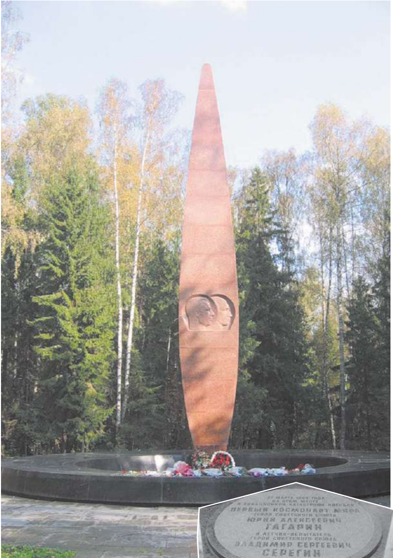
Место гибели Юрия Гагарина и Владимира Серёгина

Идея построить здесь комплекс появилась более трёх лет назад, летом 2016 года речь шла о том, что утверждён архитектурный план комплекса и начались геологоразведочные работы. По подсчётам автора проекта, на его реализацию потребуется около 100 млн рублей. Идею реконструкции продвигает Благотворительный фонд памяти первого космонавта планеты и его лётного наставника.